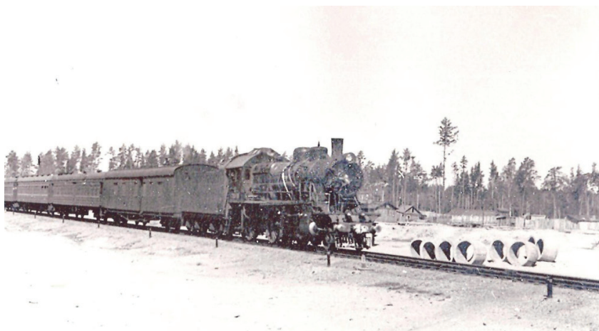
Станция Ребриха. Первый состав, который пришёл на станцию в 1954 г.