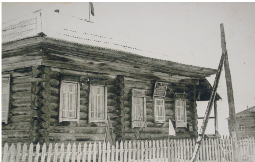
Село Рожнев Лог. Сельсовет 1960-е