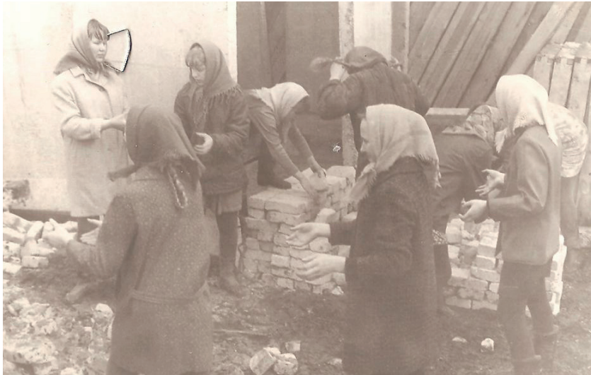
Посёлок Молодёжный. Трудовой десант