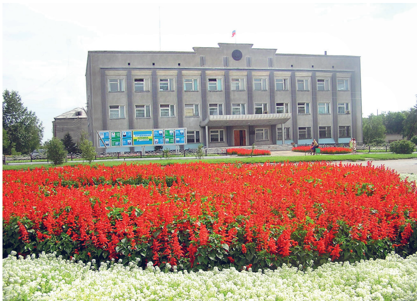
Село Ребриха. 2014