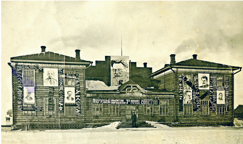
Село Ребриха. Дом культуры