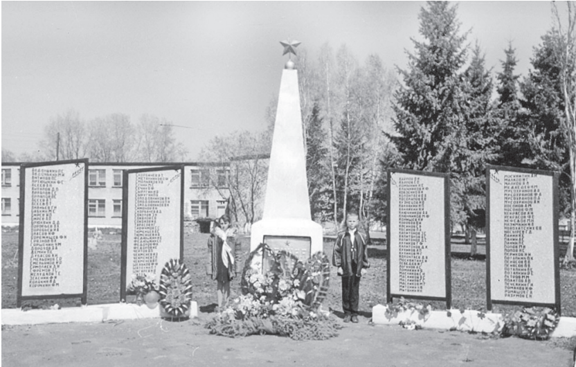
Село Шумилиха. Мемориал