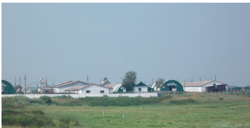
Село Ключки. ООО «Вепрь», 2014 г