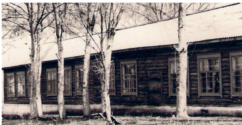
Село Зелёная роща. С старая школа