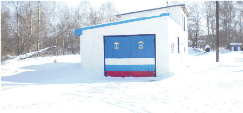
Село Шумилиха. 2010 г.