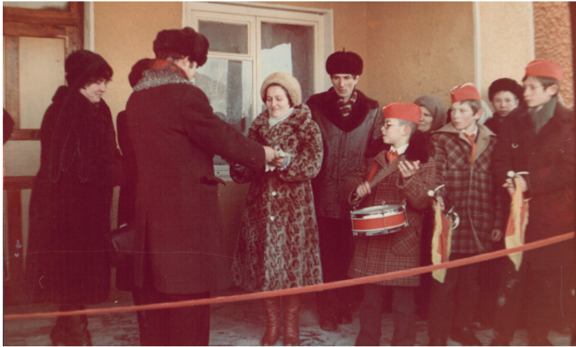
Село Паново. Открытие ДК — декабрь 1986 г.