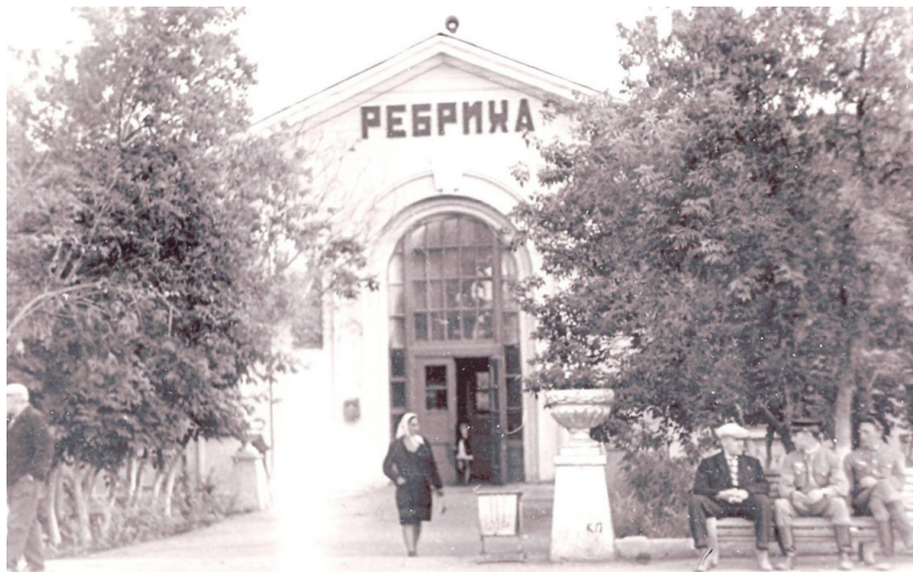
Станция Ребриха. Здание железнодорожного вокзала, построено в 1953 г.