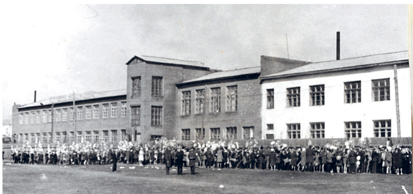
Село Ребриха. Универмаг 60-е годы