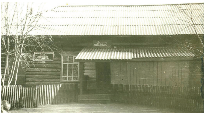
Посёлок Орёл. Школа, 1980 г.