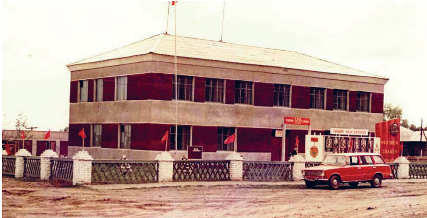
Село Боровлянка. Контора колхоза им. 22 партсъезда в 80-е годы