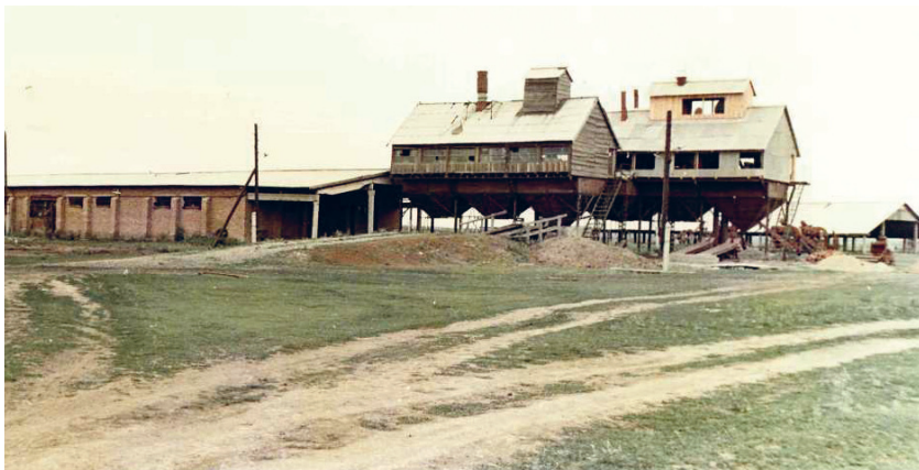
Село Боровлянка. Мехток 80-е годы