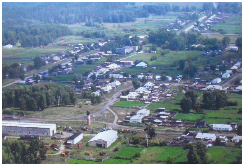
Село Зелёная роща. Вид сверху