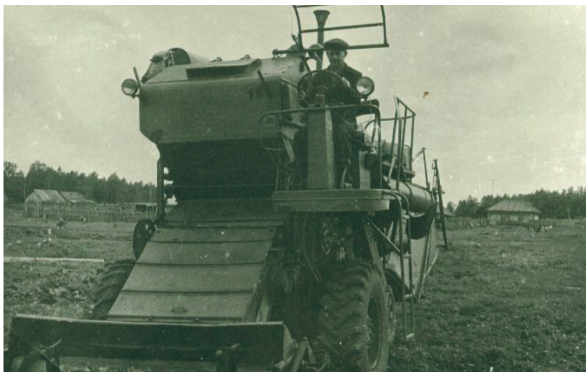
Посёлок Орёл. Полевые работы в самом разгаре