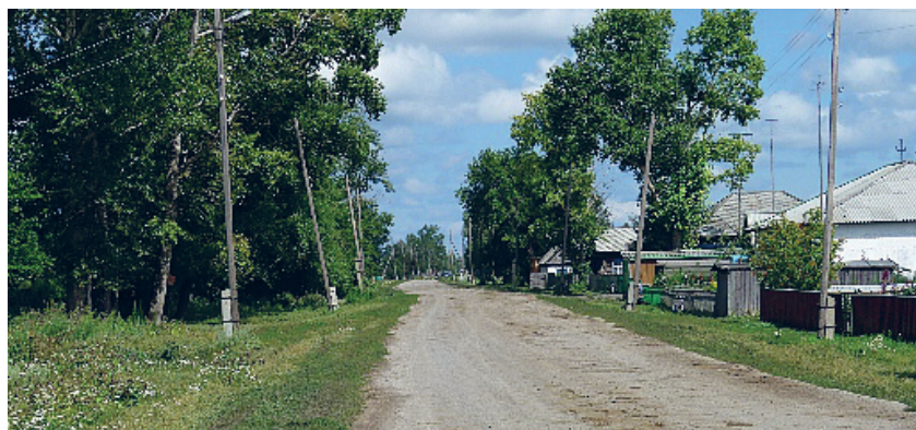
Село Подстепное. Улица Орджоникидзе от переулка Кирова к центру