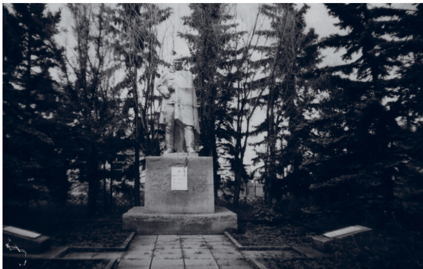
Село Ясная Поляна. Памятник