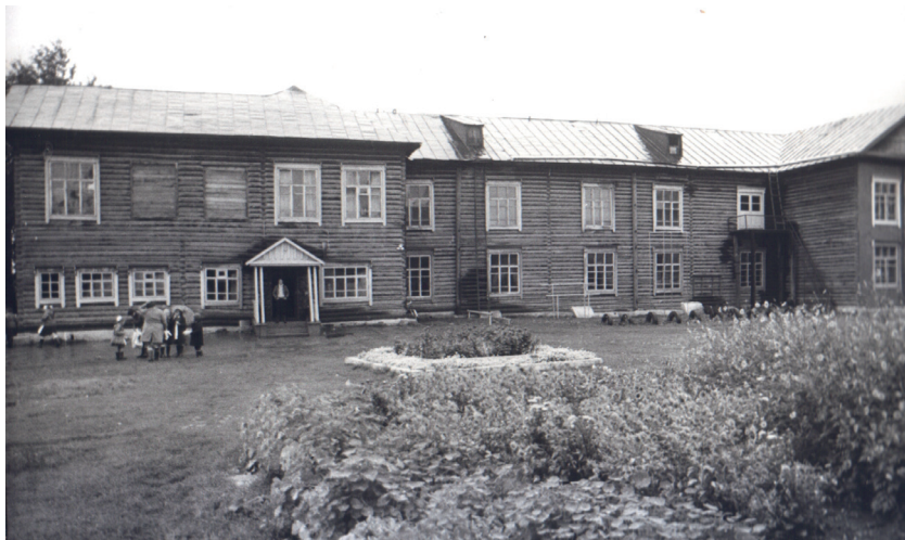
Село Паново. Здание школы — 1961 г.