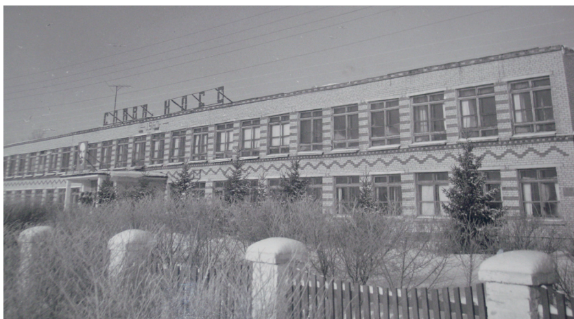
Село Рожнев Лог. Здание школы 1980-е