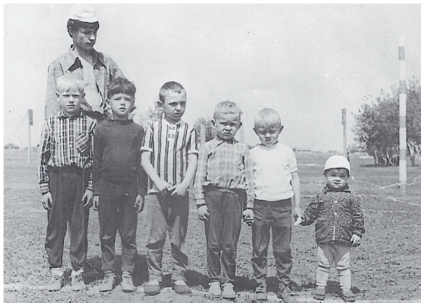
Село Подстепное. Возрастная уличная команда Орджоникидзе