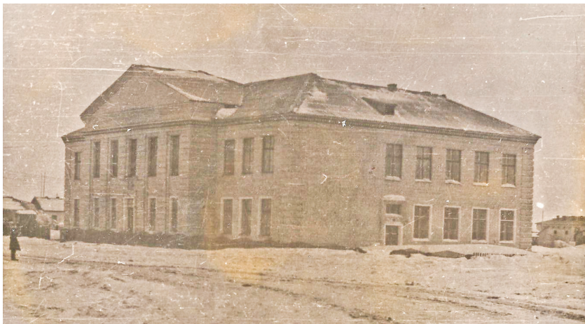
Посёлок Молодёжный. Школа построена в 1961 году