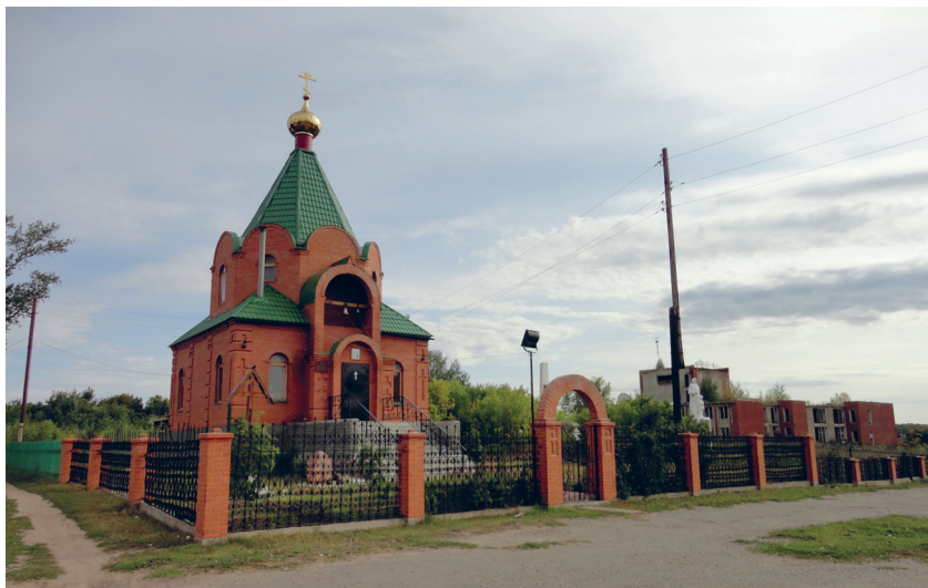
Село Ключки. Церковь, 2014 г